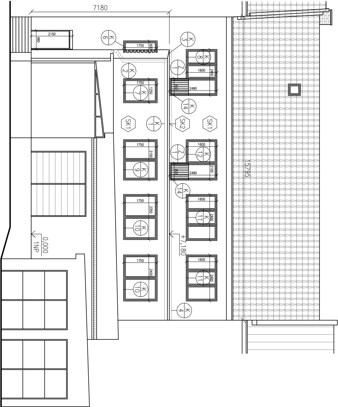
POHLED ZE DVORA - ČELNÍ - "1"